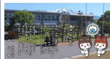
酒田市内の小中学校等