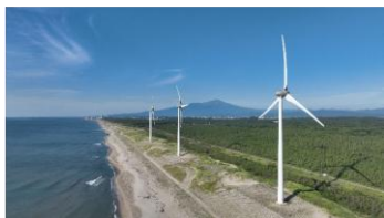
酒田市十里塚風力発電所