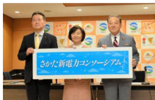
地域新電力の事業者